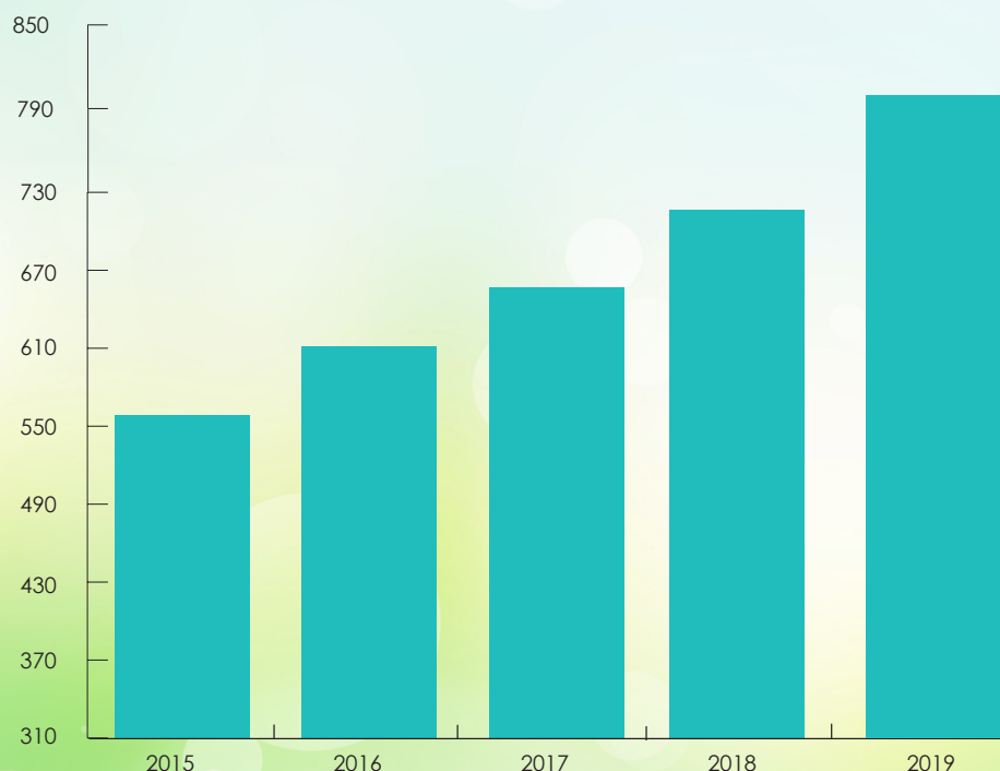
Evolution des emballages collectés par an et par habitant depuis 2015